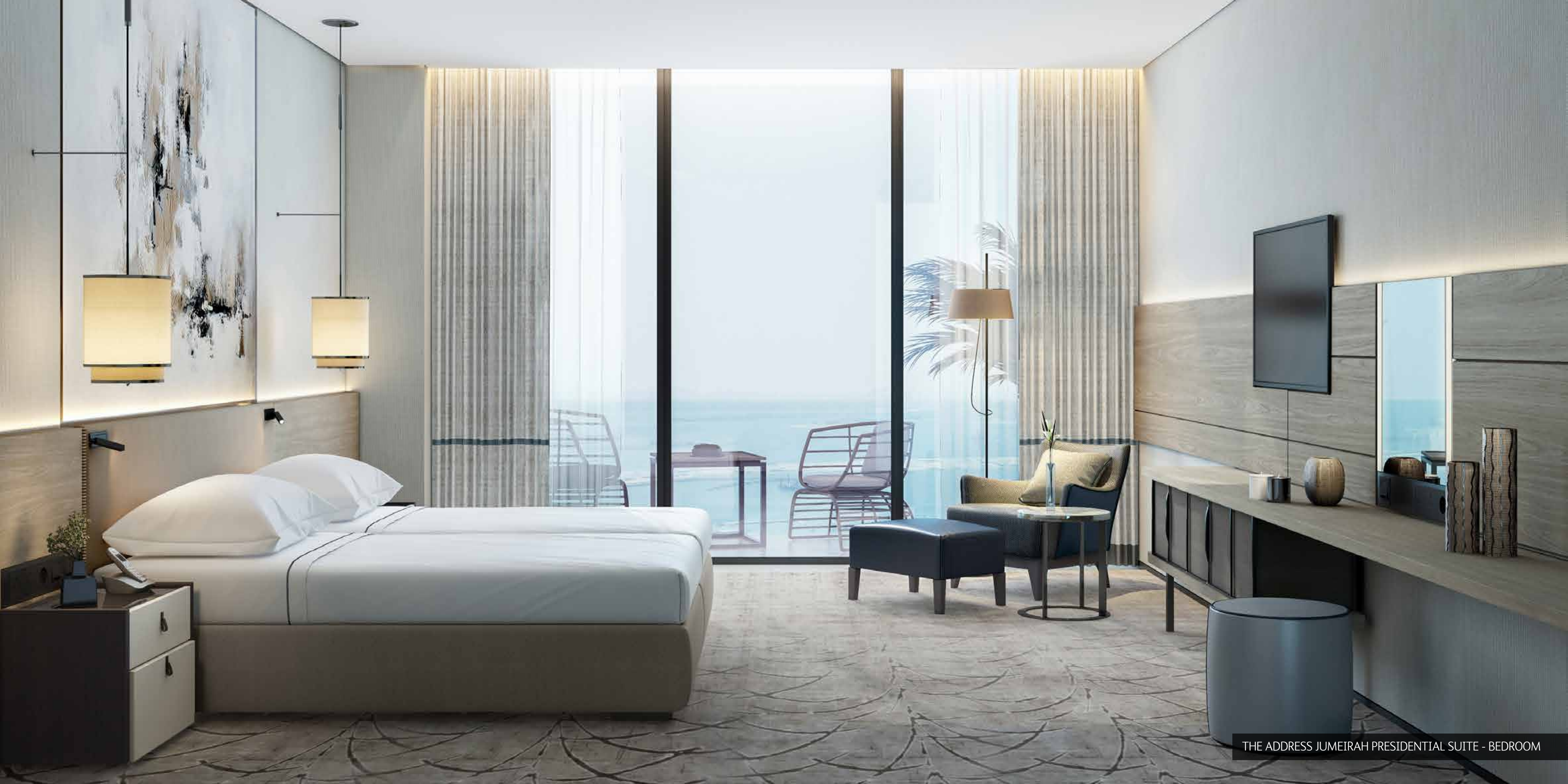
THE ADDRESS JUMEIRAH PRESIDENTIAL SUITE - BEDROOM