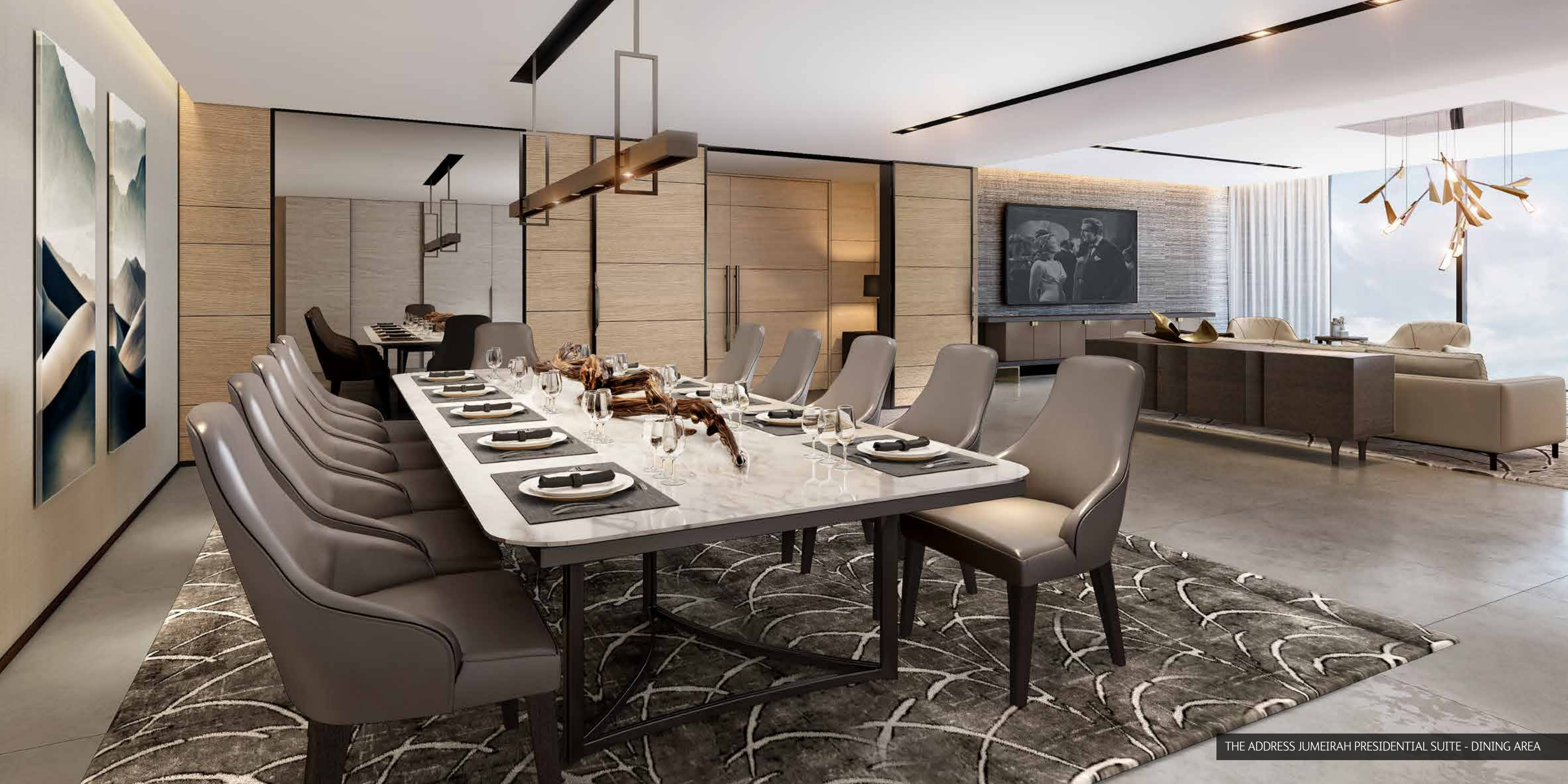
THE ADDRESS JUMEIRAH PRESIDENTIAL SUITE - DINING AREA