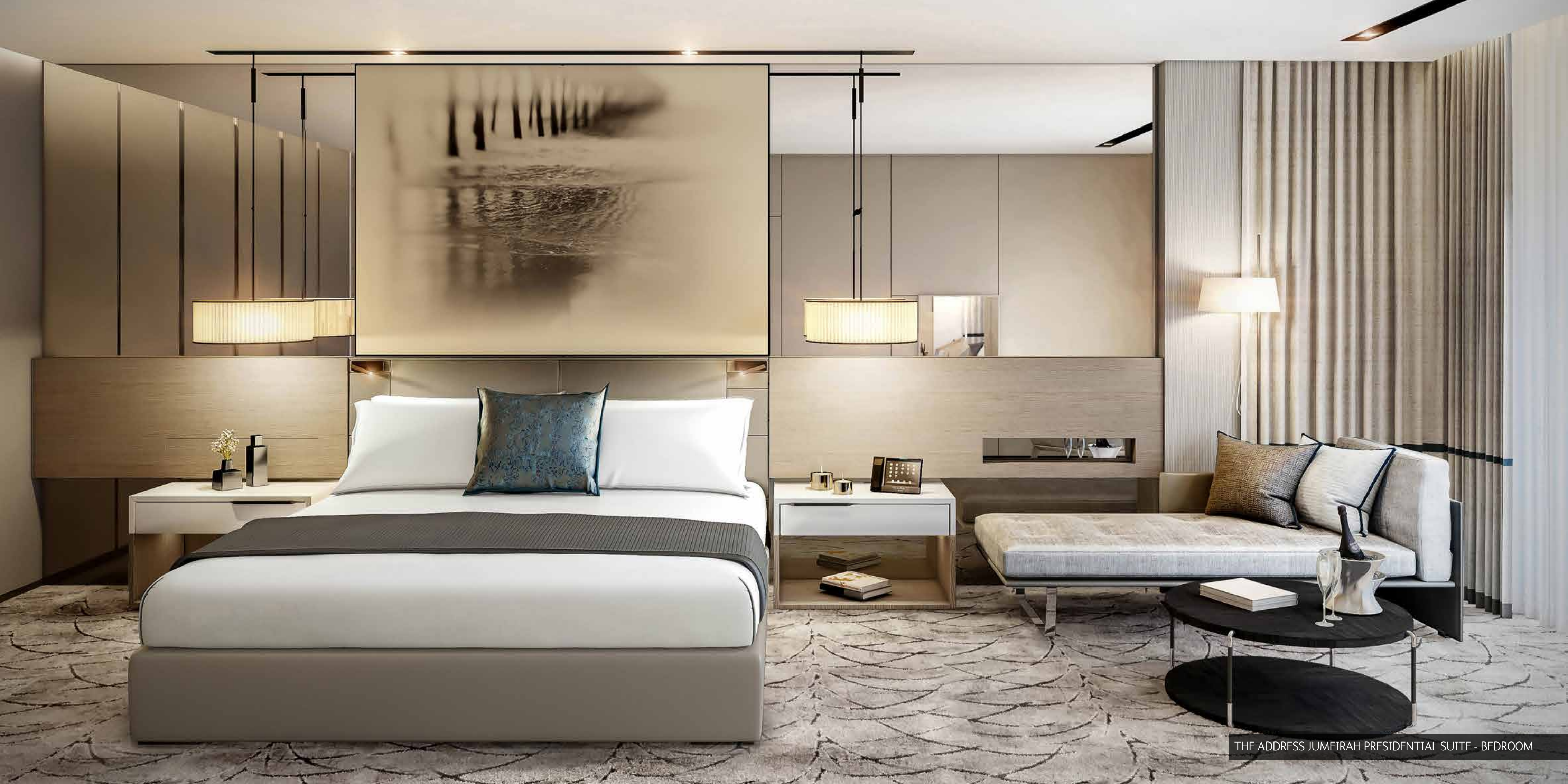
THE ADDRESS JUMEIRAH PRESIDENTIAL SUITE - BEDROOM