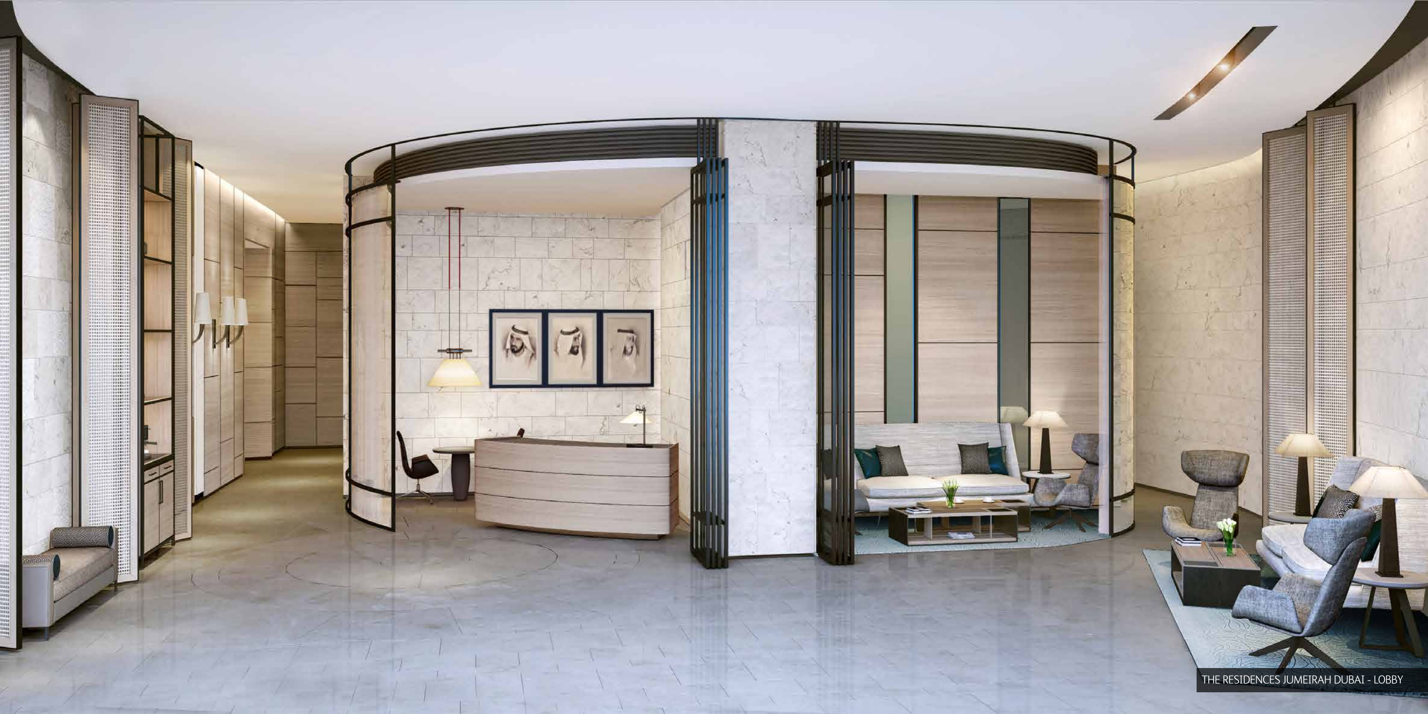
THE RESIDENCES JUMEIRAH DUBAI - LOBBY