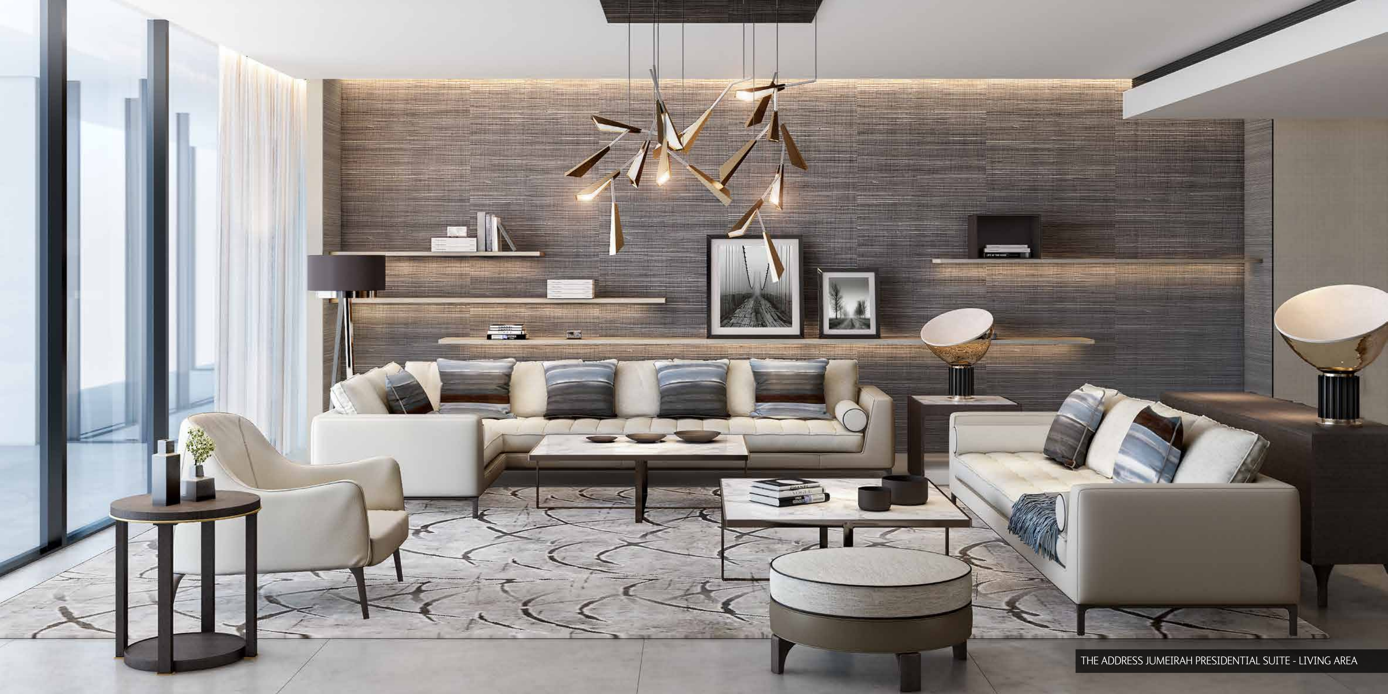
THE ADDRESS JUMEIRAH PRESIDENTIAL SUITE - LIVING AREA