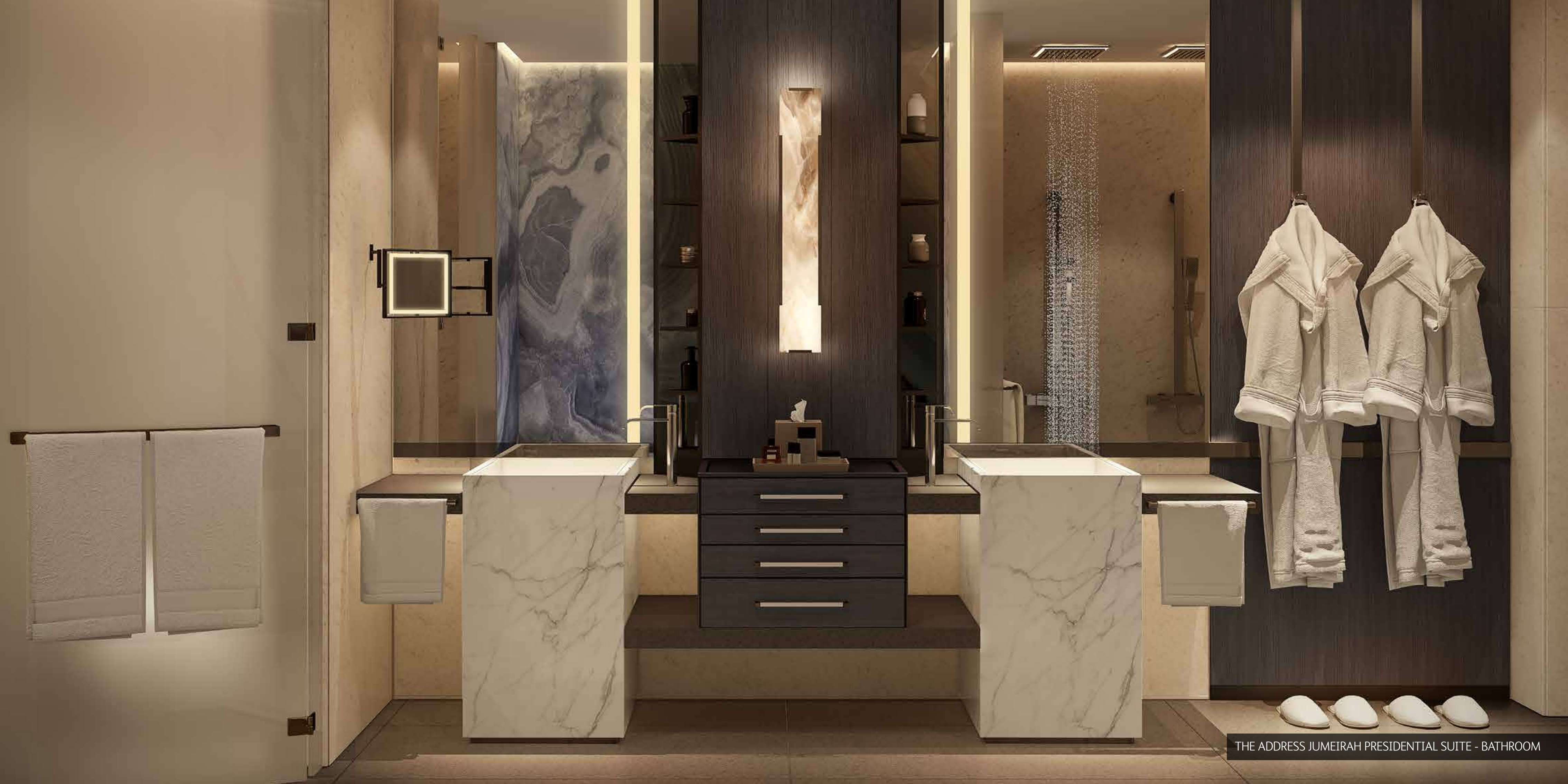
THE ADDRESS JUMEIRAH PRESIDENTIAL SUITE - BATHROOM