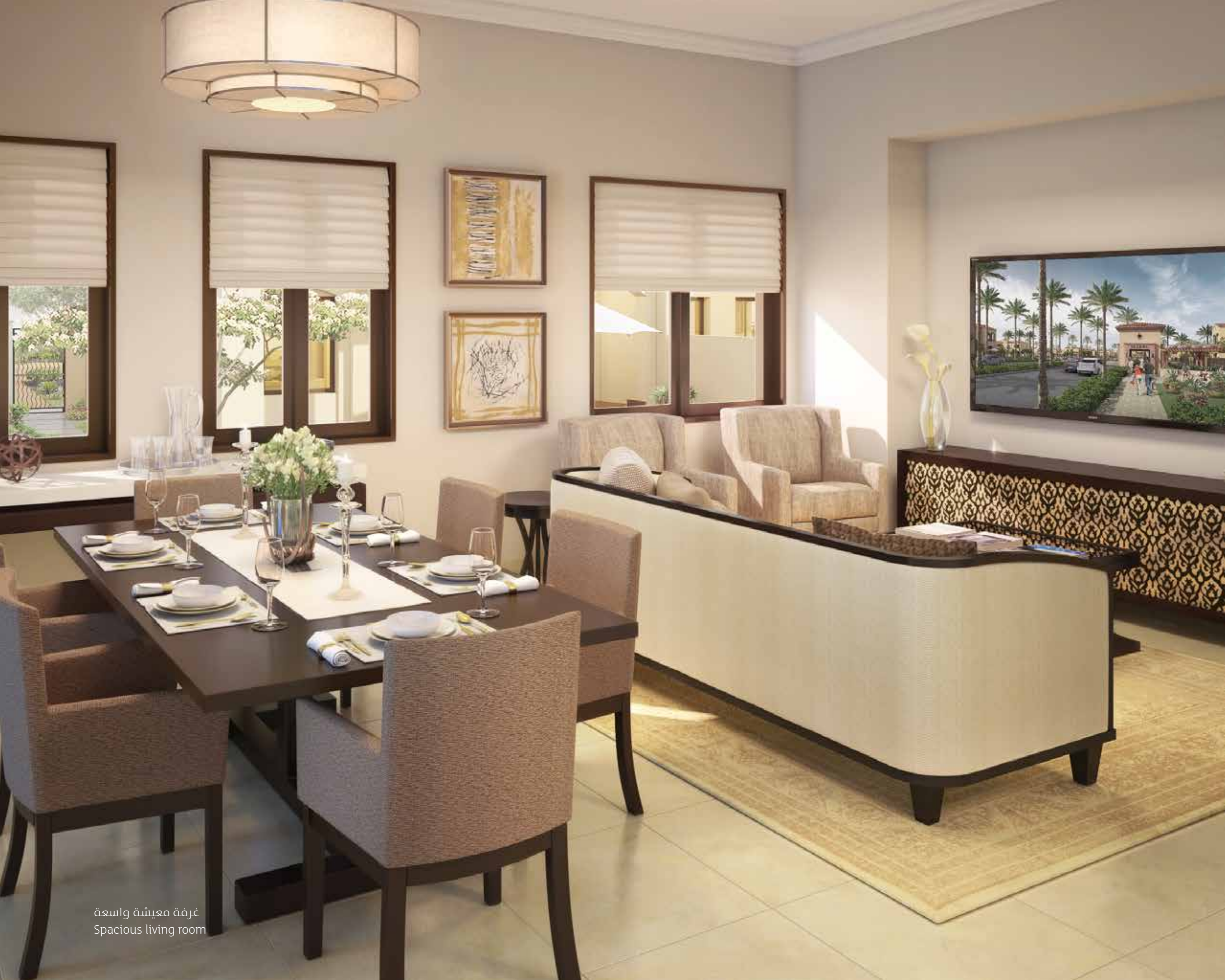
غرفة معيشة واسعة Spacious living room