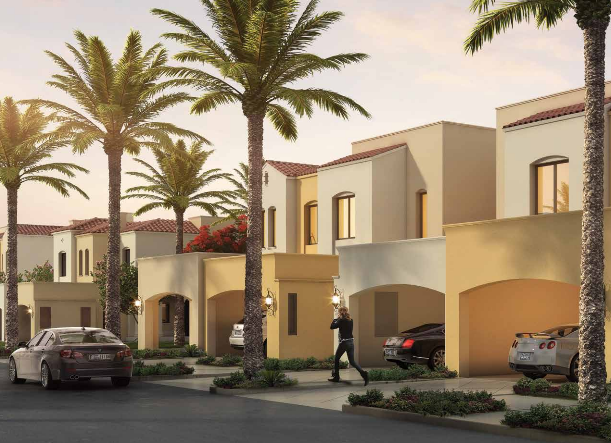
جمال الأجواء الطبيعية في قلب دبي العصرية Enjoy a Mediterranean-inspired lifestyle