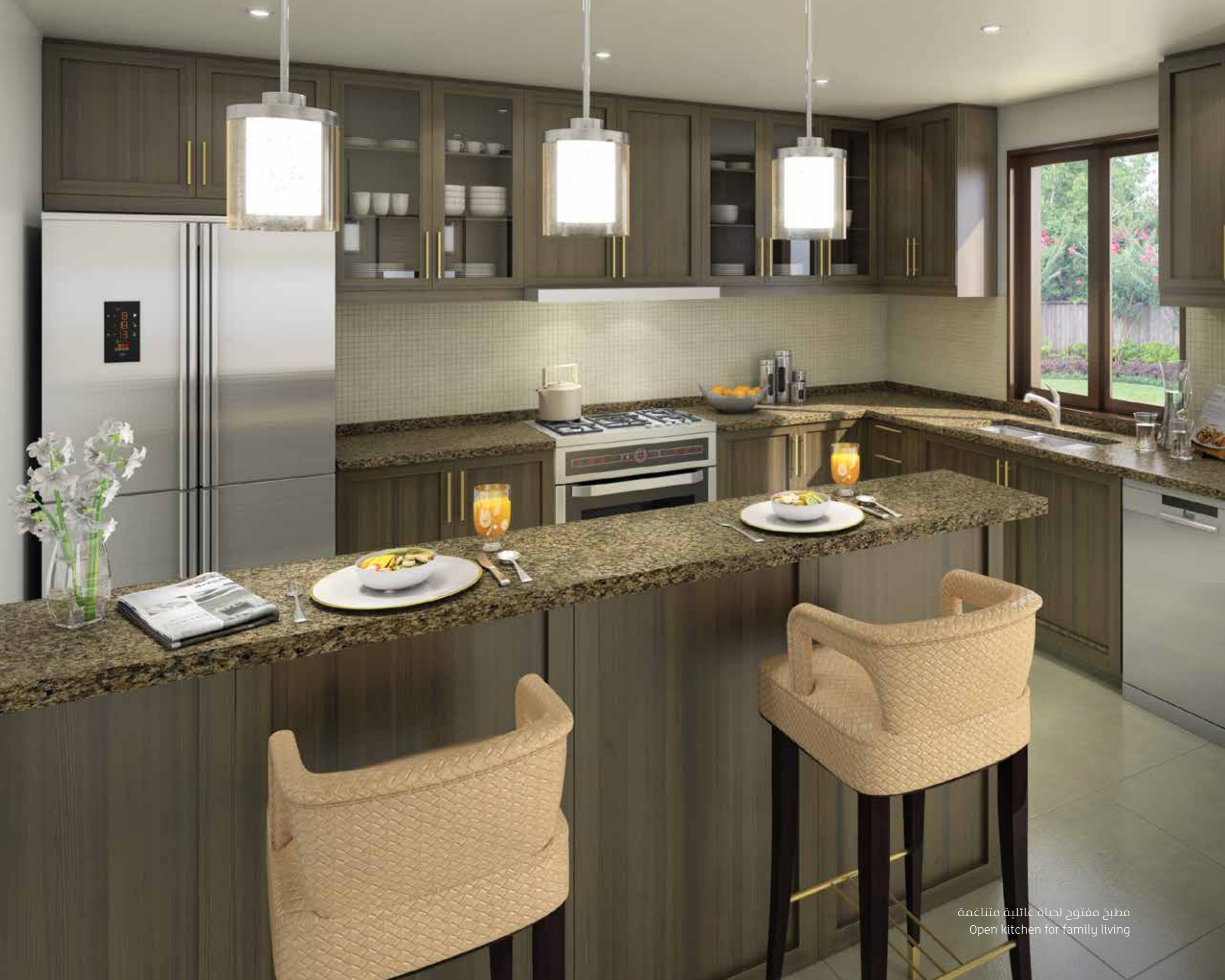
مطبخ مفتوح لحياة عائلية متناغمة Open kitchen for family living