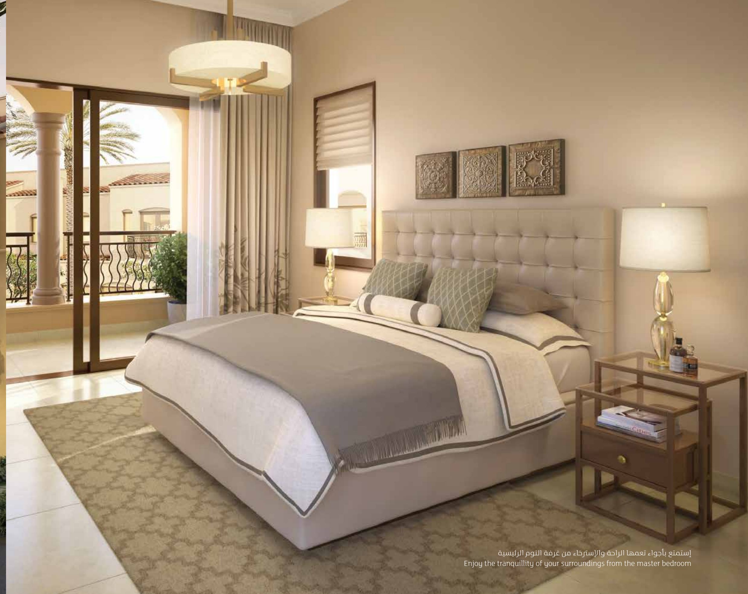
إستمتع بأجواء تعميها الراحة والإسترخاء من غرفة النوم الرئيسية Enjoy the tranquility of your surroundings from the master bedroom